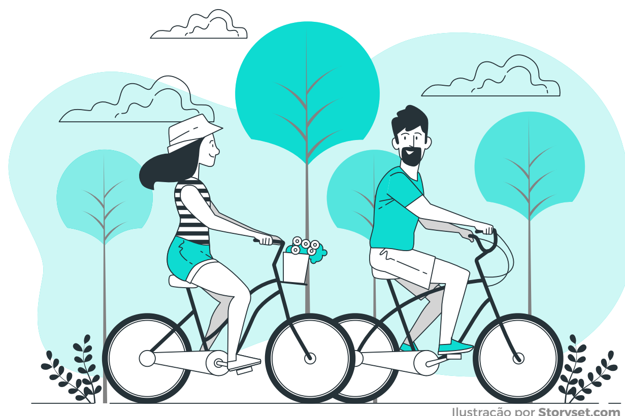
Ilustração por Storyset.com

O aplicativo detecta automaticamente o modo de transporte utilizado pelos usuários, como caminhar, andar de bicicleta ou utilizar o transporte público, e calcula a quantidade de CO2 economizada ao escolher opções sustentáveis.